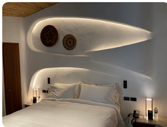
Hôtel Cala di Volpe - Sardaigne

Ambiance Lumière, c'est aussi de la fibre optique, des lignes lumières, des spots et projecteurs et plus de 45 ans d'expertise en solutions lumineuses. N'hésitez pas à nous contacter pour toute question.